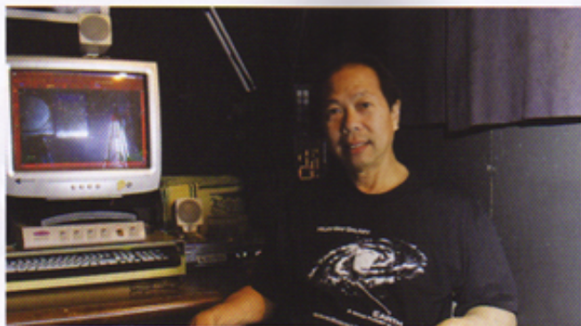
↑ホノルル市役所で土地利用の研究をするのが本職というレイさん。星の知識も専門家級なんだ。