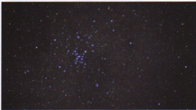
↑オアフ島での輝く星空を眺めることができる。