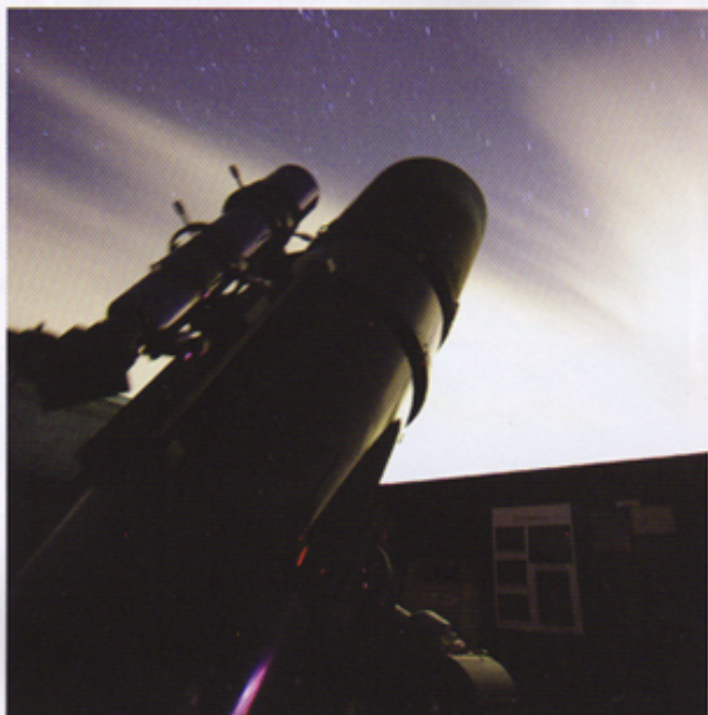
↑望遠鏡はコンピュータと接続され、星座の名をインプットすると自動的に望遠鏡が星座の角度を計算し、星座を映し出すシステム。